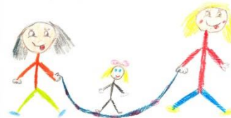
hop - s mámou, tátou