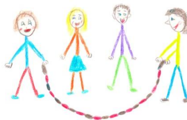
kamarádi hop - výměna

V každé dané kategorii může skákat vždy jeden člen spadající o jednu kategorii výš nebo níž.